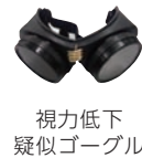
視力低下 疑似ゴーグル